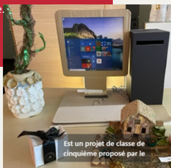
Est un projet de classe de cinquième proposé par le

L'exposition, qui s'est tenue jusqu'à aujourd'hui, a permis d'élire les œuvres des élèves.