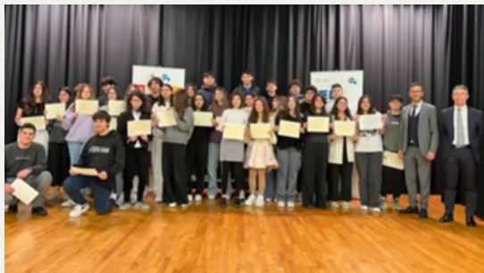
16 janvier : Cérémonie de Remise des Attestations du Brevet Libanais et des diplômes du DNB